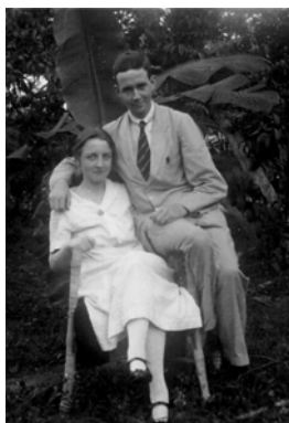
Das Hochzeitspaar am 09.02.1928